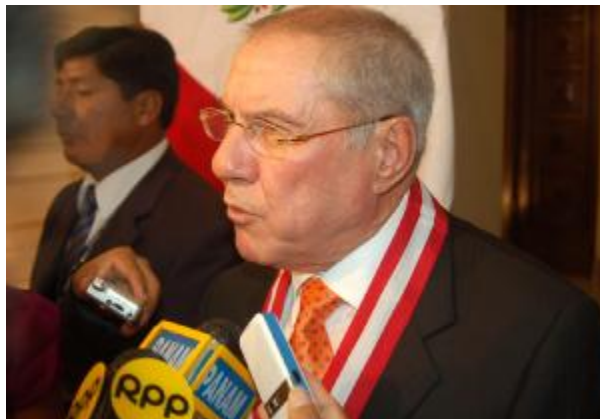
Presidente del Poder Judicial declara a la prensa

En ese sentido, manifestó que se deben invertir recursos económicos en capacitar jueces de paz, construir locales para sus juzgados, y promover acciones de difusión entre los ciudadanos de las zonas pobres y apartadas del país, que requieren de una justicia pronta y efectiva.