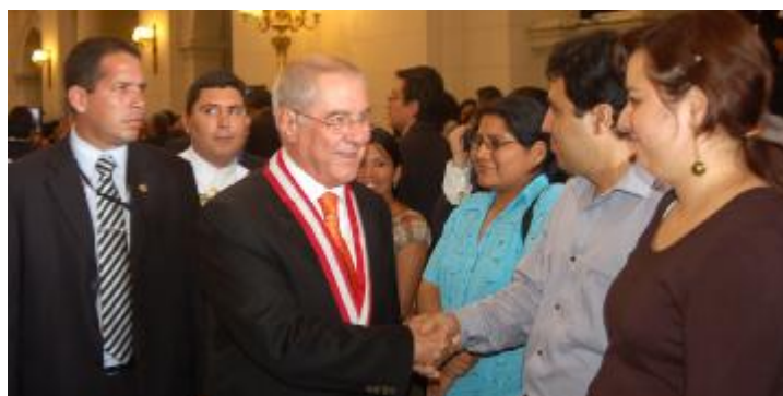
Dr. Villa Stein saluda a Jueces

U na exhortación a los jueces de todo el país, a mantenerse unidos y cohesionados, y a luchar frontalmente contra la corrupción, hizo el Presidente del Poder Judicial, doctor Javier Villa Stein, durante la reunión que sostuvo con 400 magistrados de las Cortes Superiores de Justicia de Lima, Lima Norte y Callao.