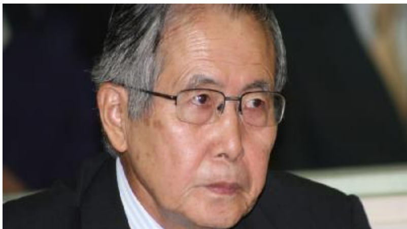
Acusado Alberto Fujimori

“El ex dictador ha sido condenado por dos secuestros y dos matanzas particularmente crueles de las muchas que se perpetraron durante su régimen, pero no por el delito más grave que cometió: haber destruido mediante un acto de fuerza militar el 5 de abril