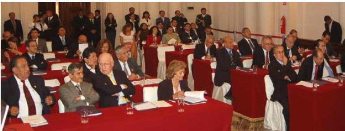
Magistrados participantes en Mesa de Diálogo “Poder Judicial y la Economía Nacional”

Señaló que teóricamente, los costos del Derecho son inversamente proporcionales al íntegro de la población.