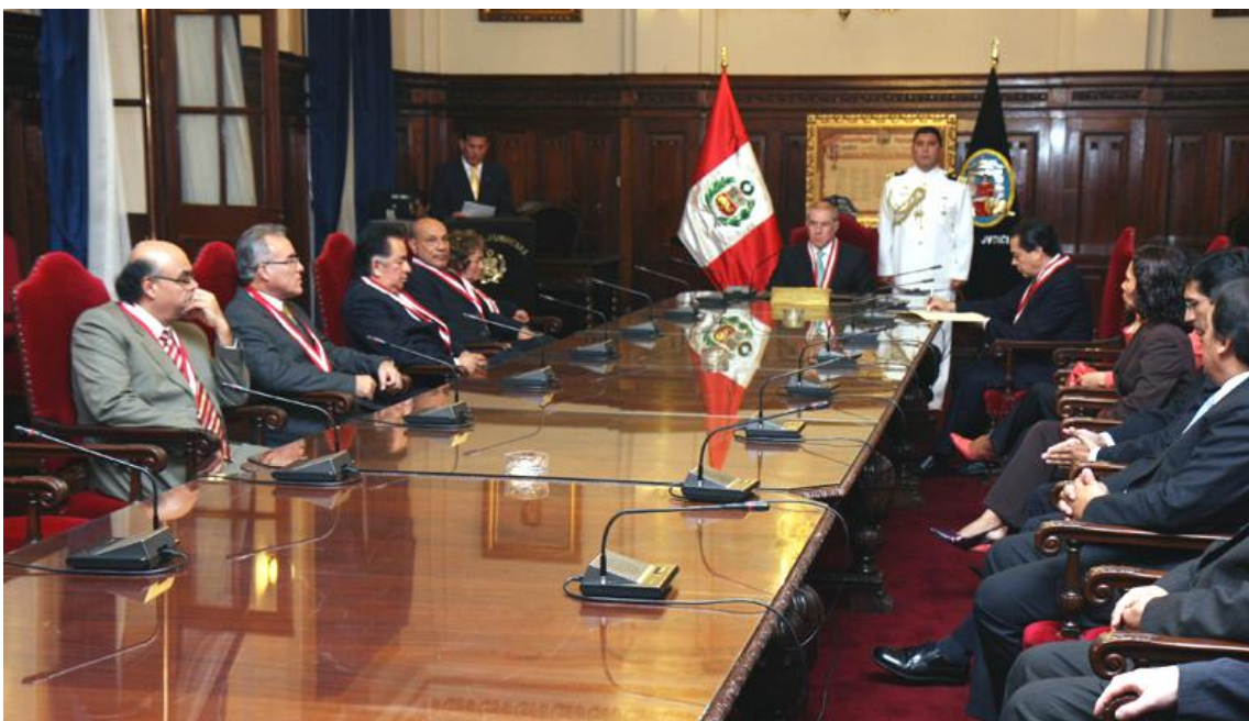
Integrantes de la Comisión que medirá calidad y producción de fallos judiciales

Manifestó que la propuesta que elabore la Comisión será el germen del proyecto que se presentará al Congreso de la República sobre la evaluación permanente a los jueces. "Queremos que la evaluación sea diaria, cotidiana, porque todos los días sabremos por qué demoró un expediente o resolución", indicó.