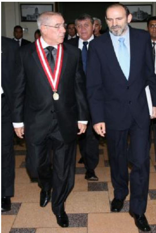
Javier Villa Stein y Yehude Simon

E l Presidente del Poder Judicial, Javier Villa Stein, se entrevistó con el Jefe del Gabinete Ministerial, Yehude Simón Munaro, para tratar el tema de la problemática del Valle de los Ríos Apurímac y Ene (VRAE).